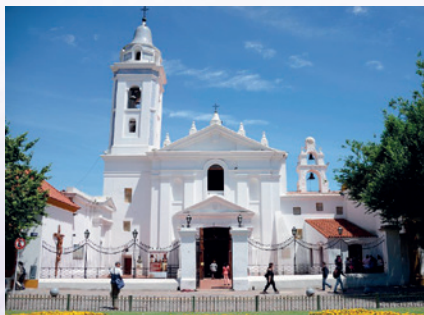
Basílica de Nuestra señora del Pilar (Buenos Aires)

Durante todos estos años, la asociación ha mantenido correspondencia con muchas de ellas, algunas siguen activas y otras han ido desapareciendo, al no encontrar relevos en sus parroquias.