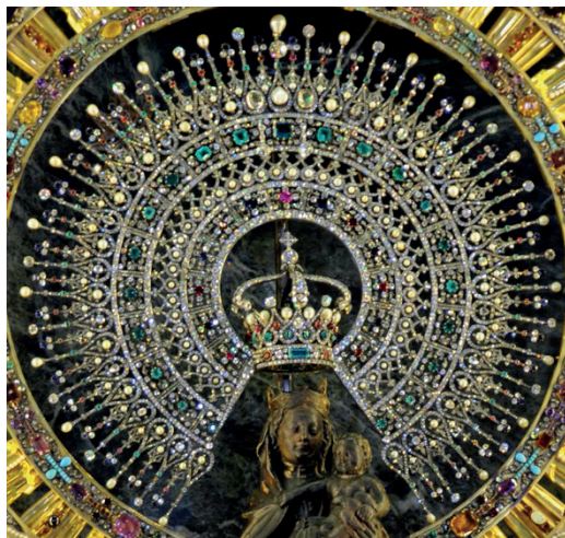
Primera corona de la Virgen del Pilar 1905

En 1905, los españoles ofrecieron a la Virgen del Pilar la gran corona, que encargaron a la prestigiosa joyería Ansorena y que consistía en la realización de dos coronas: una pequeña para el Niño y la grande para la Virgen.