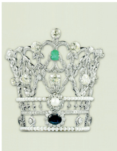
Corona reversible (1902-2002)

“Las Damas de Honor donaron dinero y joyas de su propiedad, contribuyendo en la medida de sus posibilidades.