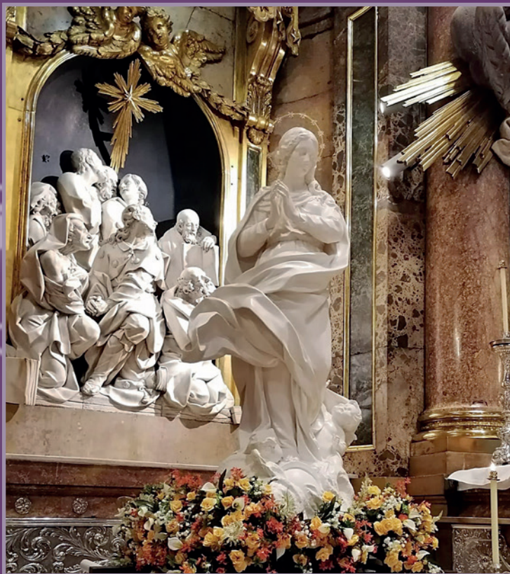
Virgen de Éfeso con motivo de su visita a Zaragoza